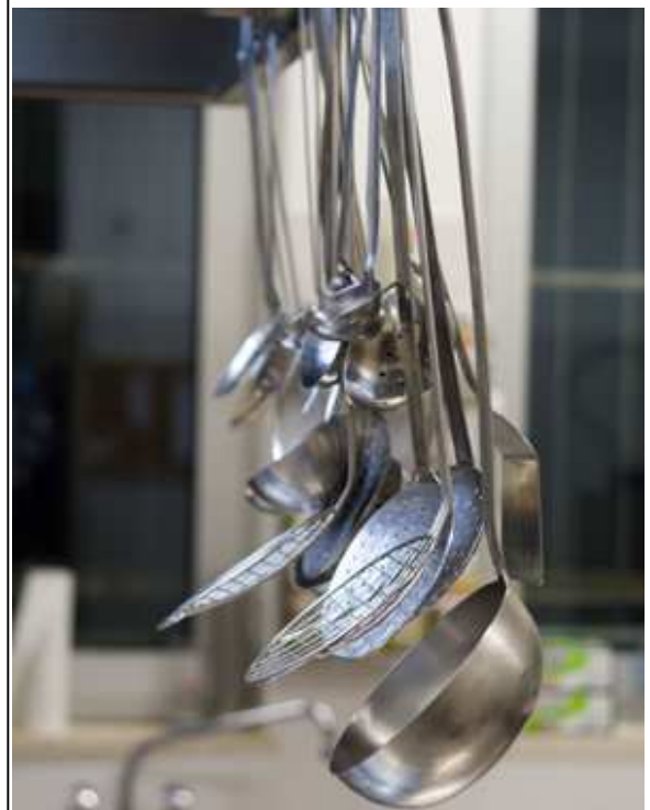
utensili da cucina