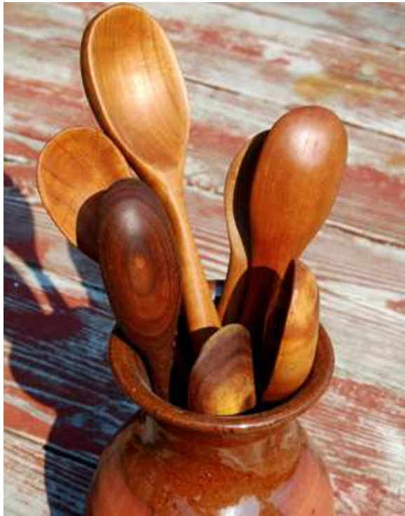
cucchiaini di legno